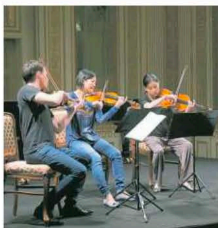
Il concerto del Quatuor Hermès