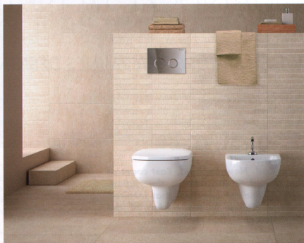
The boiler Osa and, under, the Pozzi Ginori with Geberit flushing plates

this, we are sure, is just a starting point for the Geberit Group.